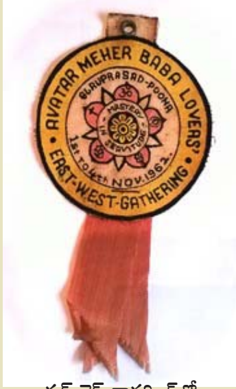
ఈస్ట్ వెస్ట్ గాథరింగ్లో ప్రేమికులకు ఇచ్చిన బ్యాడ్జి

నూచించడంతో వారు ఆ వ్రయత్నం విరమించుకున్నారు. అవతారుడి సప్తవర్ణ పతాకాన్ని పెద్దసైజు గల దాన్ని ఇంజనుకు ముందు ఎగురవేశారు. అలాగే చిన్న జెండాలను రైలు బోగీలకు అలంకరించారు. బోగీలకు బైట బాబా చిత్రపటాలను అతికించారు. సహవాస్ సమయంలో బాబా సందేశాలతో కట్టిన బ్యానర్లను కూడా రైలు బోగీలకు బైటవైపు కట్టి అందంగా అలంకరించారు. రైలు బయల్దేరడానికి గట్టిగా కూత పెట్టింది. ఇక బయల్దేరమని రైలు డ్రైవర్కి అవతారుడు తన రెండు చేతులు వూపుతూ సంకేతాలు ఇచ్చారు. అవతారుని జయ జయ ధ్యానాలతో బాబా ప్రేమ నిండిన హృదయాలతో సహవాసీలు తమ స్వగ్రామాలకు ప్రయాణమయ్యారు. “నేను ఆనందంగా వున్నాను. నన్ను మీతో తీసుకెళ్ళండని” బాబా సంజ్ఞలు చేస్తుంటే,