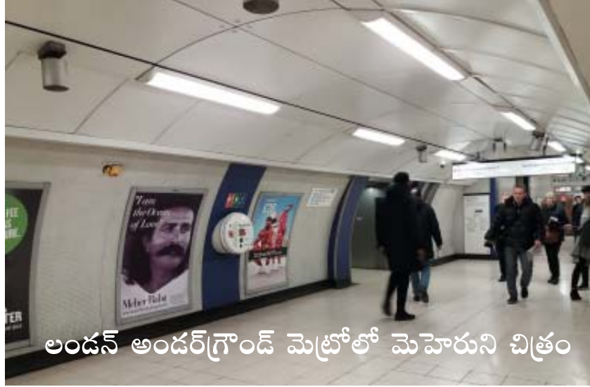
లండన్ అండర్గ్రౌండ్ మెట్రోలో మెహెరుని చిత్రం