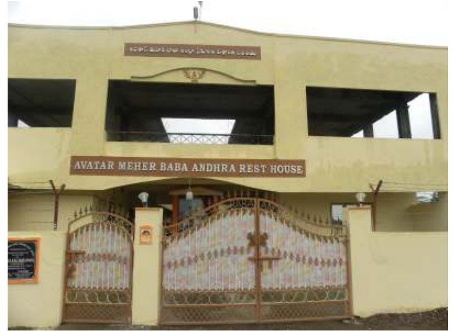
మెహెరాబాద్ లో బాబా ప్రేమికులకు చక్కని ఆతిథ్యం ఇస్తున్న ఆంధ్రా రెస్ట్ హౌస్.