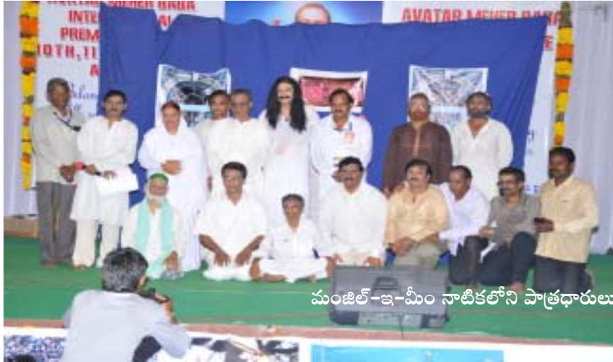
మంజిల్-ఇ-మీం నాటికలోని పాత్రధారులు